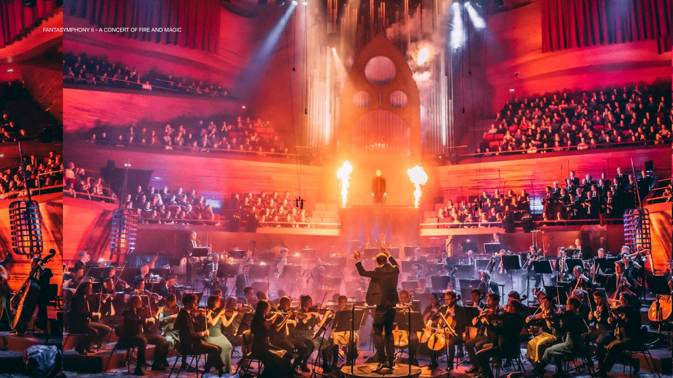
FANTASYMPHONY II - A CONCERT OF FIRE AND MAGIC