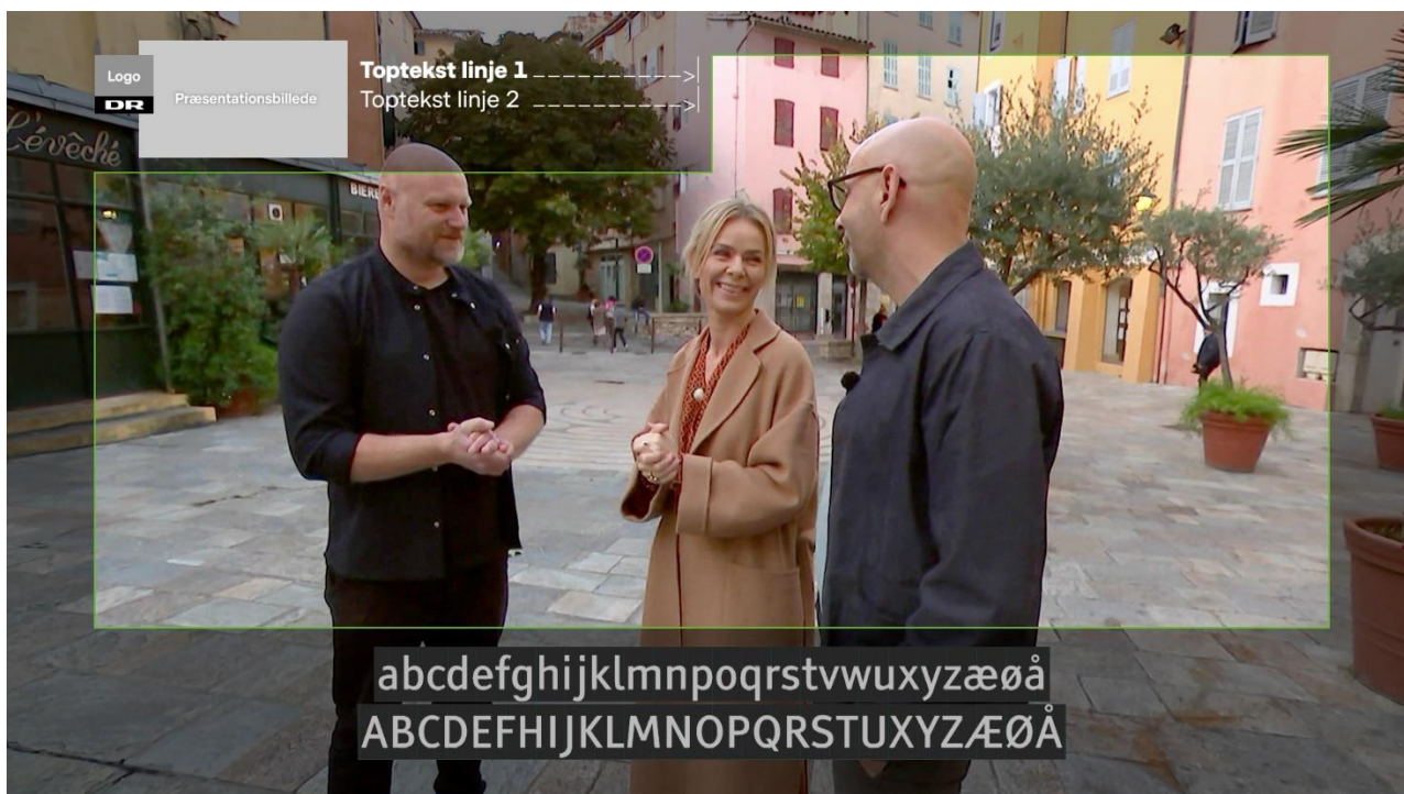
Figur 1: Eksempel på safe area – se link for skabeloner

Bemærk at der er forskellige safe-areas til hhv. program og kreditering. Inden der lægges grafik på et program, er det derfor vigtigt at orientere sig på overstående link.