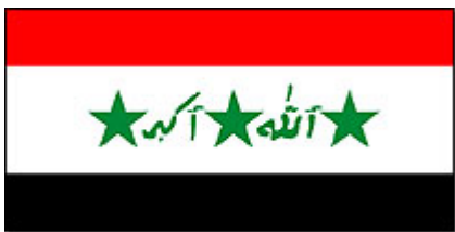
Det irakiske flag

I midten er der tre grønne stjerner, der står for enhed, frihed og socialisme. Imellem stjernerne står ordene 'Allah er stor' i grøn arabisk skrift. Den muslimske sætning blev tilføjet flaget i 1991 under Golfkrigen, hvor Saddam Hussein ønskede at trække landet i en klarere islamisk retning.