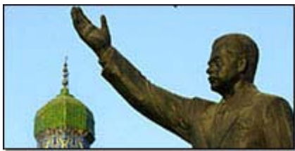
Islam og Saddam Hussein præger billedet

Ifølge Iraks midlertidige forfatning fra 1970 er landet en demokratisk folkerepublik med socialisme som mål og islam som statsreligion. I 1979 kom Saddam Hussein til magten som præsident for livstid, og landet har siden været diktatorisk styret af præsidenten og hans familie.