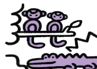
FEM SMÅ ABER