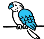
DEN LILLE UNDULAT