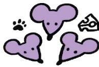
ALLE DE MANGE MUS