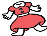
SE MIN KJOLE