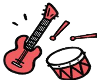
NÅR JEG STÅR OP OM MORGENEN